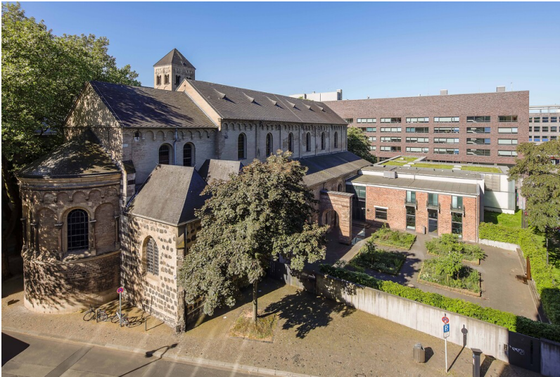
Der Stift St. Cäcilia in der Kölner Altstadt-Süd, heute Sitz des städtischen Museums Schnütgen für mittelalterliche Kunst (2019).