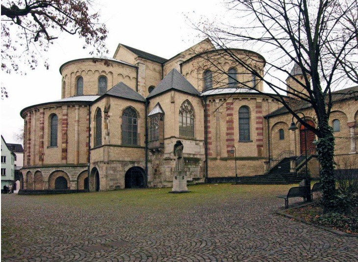
Die Kölner Benediktinerinnenabtei, später Kanonissenstift Sankt Maria im Kapitol, hier die Dreikonchenanlage und die Skulptur "Die Trauernde" aus nordöstlicher Richtung (2004)