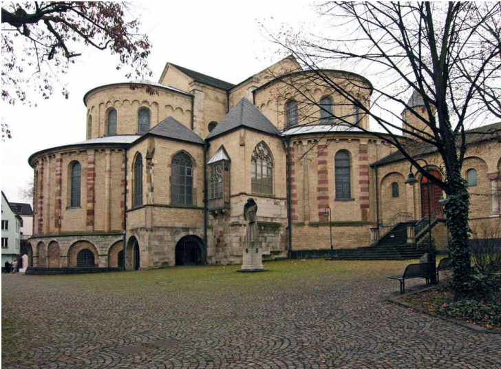
Die Kölner Benediktinerinnenabtei, später Kanonissenstift Sankt Maria im Kapitol, hier die Dreikonchenanlage und die Skulptur "Die Trauernde" aus nordöstlicher Richtung (2004)