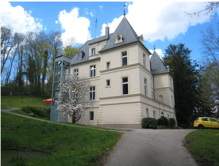
Haus Mörner in Bornheim-Roisdorf (2016), Südostansicht.