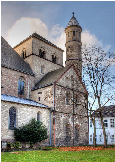
Die frühere Abtei St. Pantaleon in Köln, Ansicht von Norden auf das Westwerk mit Nordannex und Nordturm (2009).