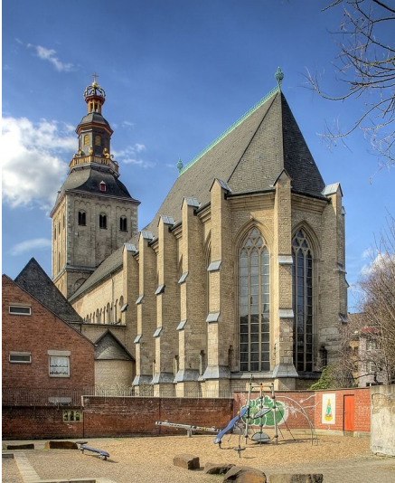
Das Kirchengebäude des früheren Kanonissenstifts St. Ursula (Ursulastift) in Köln (2010).