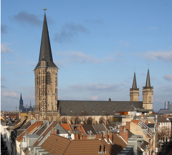
Das Kirchengebäude des Severinstifts in Köln (Severinskloster / Kollegiatstift St. Severin), Ansicht von der Severinstorbung aus (2009).