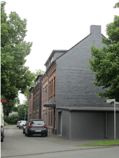
Siedlung Clarenberg in Frechen (2014)