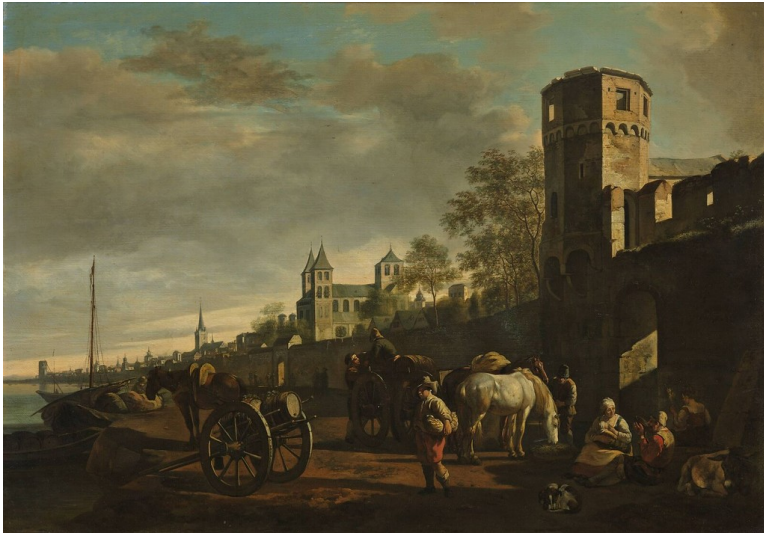
Gerrit Adriaenszoon Berckheyde: Ansicht des Rheinufer bei Köln zwischen 1654 und 1698, Öl auf Leinwand. Fotograf/Urheber: Gerrit Adriaenszoon Berckheyde