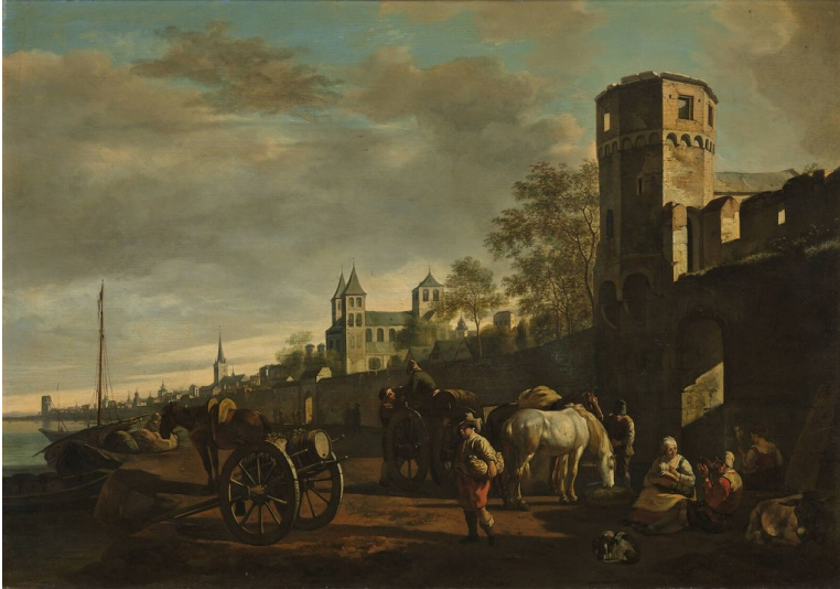
Gerrit Adriaenszoon Berckheyde: Ansicht des Rheinufer bei Köln zwischen 1654 und 1698, Öl auf Leinwand. Fotograf/Urheber: Gerrit Adriaenszoon Berckheyde