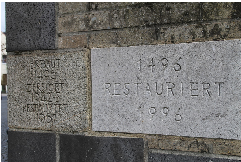
Katholische Pfarrkirche Sankt Martinus in Kerpen (2017)