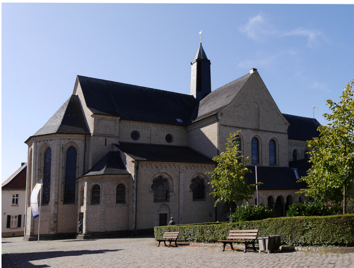
Reichsstift Kaiserswerth (2019)