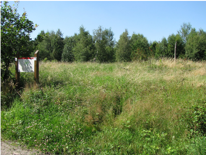
Blick auf den Standort des Limeswachturms 3/4* in Hohenstein-Born im Rheingau-Taunus-Kreis (2009)