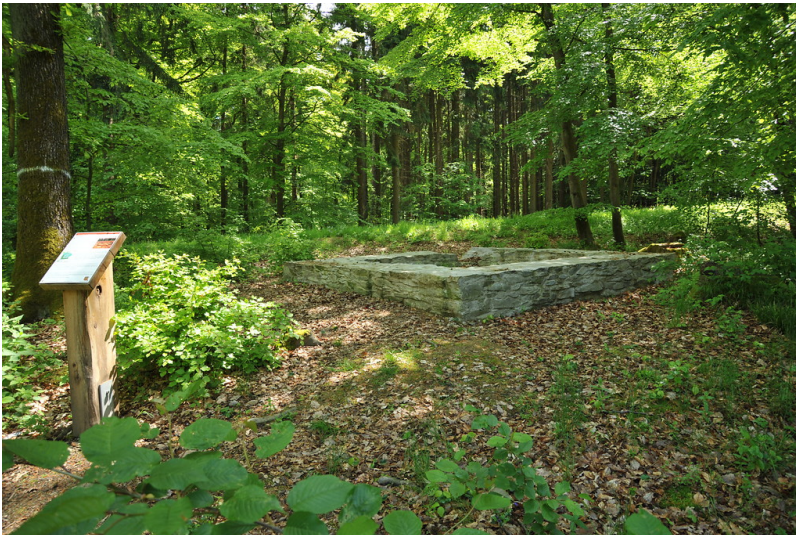
Visualisierter Grundriss des Limeswachturms Wp 3/4 bei Hohenstein-Born im Rheingau-Taunus-Kreis (2012)