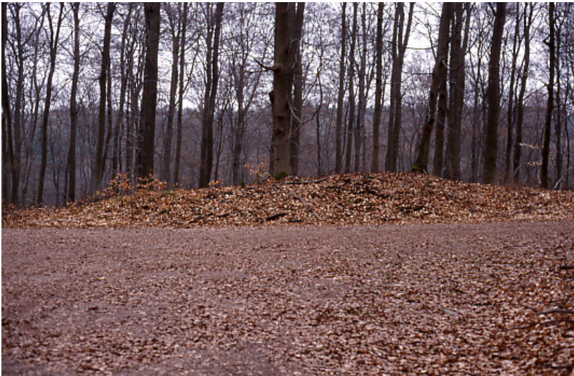
Blick auf den Schutthügel des Limeswachturms Wp 3/5 bei Taunusstein-Watzhahn im Rheingau-Taunus-Kreis (2003)