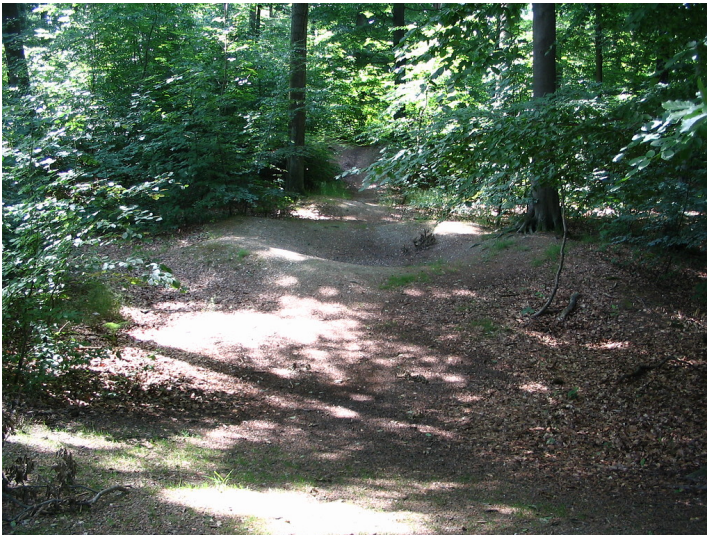
Spuren des Amphitheaters nördlich des Kastells Zugmantel bei Taunusstein-Orlen im Rheingau-Taunus-Kreis (2008)