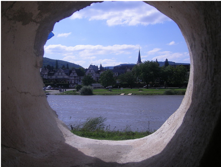
Blick aus dem "alten Fährhäuschen" am gegenüberliegenden Moselufer von Pünderich auf den Ort, im Bild der alte Ortskern mit dem Fachwerkhaus "altes Fährhaus" am Fährkopf, dem Rathaus und der Pfarrkirche "Maria Himmelfahrt" (2008).