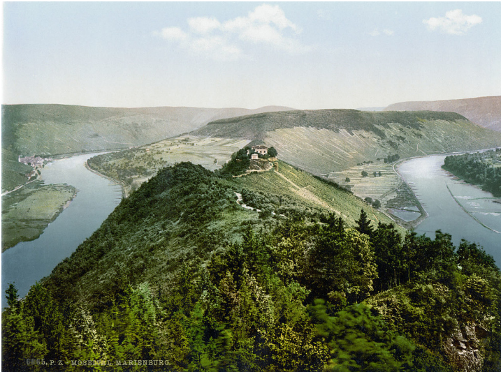
Historische Postkarte von um 1900 mit einem Blick vom Moselberg Prinzenkopf in südöstlicher Richtung über die Moselschleife Zeller Hamm und die Marienburg bei Zell an der Mosel, links im Hintergrund der Ort Merl.