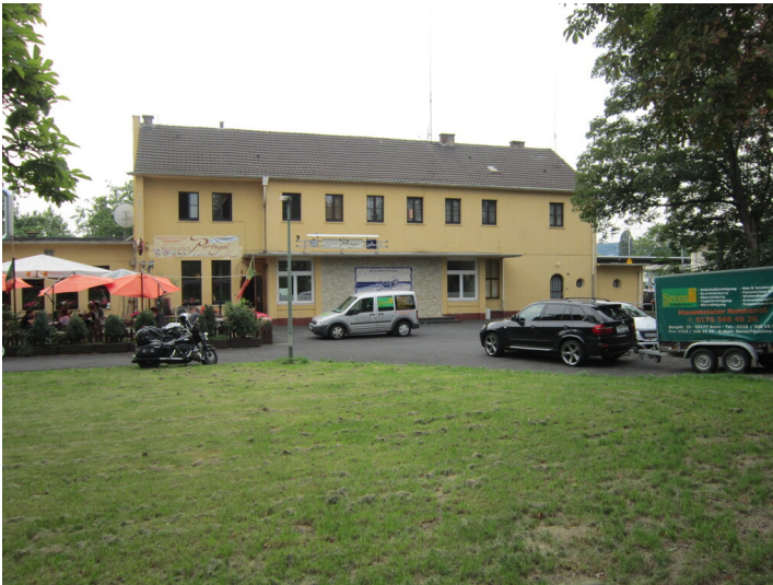
Bahnhof Mehlem in Bonn, Straßenseite (2015)