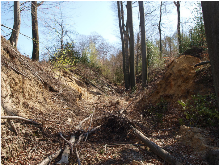
Ehemalige Fahrrinne des Hohlwegbündels am Hölenderberg in Ratingen-Eggerscheidt (2015). Die steilen Hänge sind gut zu erkennen.