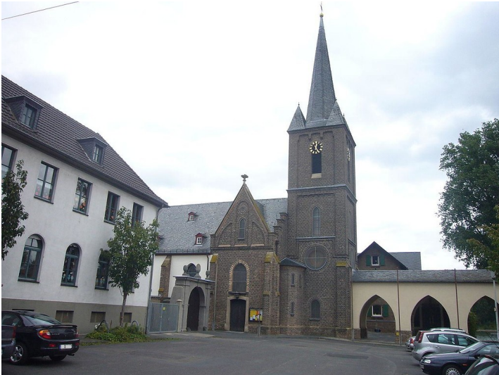
Die Pfarrkirche St. Margaretha in Graurheindorf, die sich auf dem mehrfach überbauten Bereich des ehemaligen Zisterzienserinnenklosters befindet (2011)