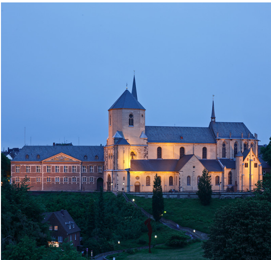
Münster St. Vitus in Mönchengladbach mit Rathaus (2012)