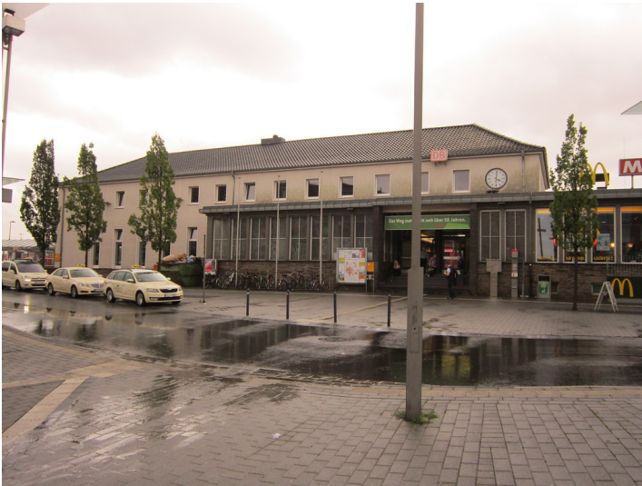
Bahnhof Euskirchen (2015). Blick von Norden über den Vorplatz auf das Empfangsgebäude.