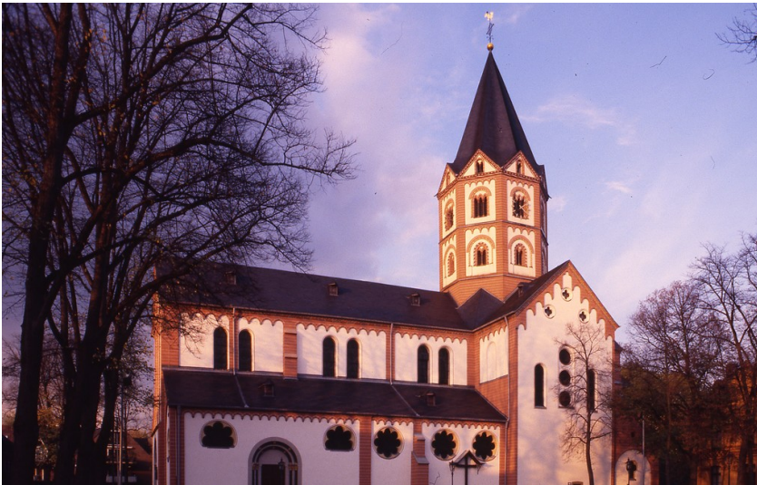
Basilika St. Margareta im Denkmalsbereich Düsseldorf-Gerresheim, Blick von Süden (2008)