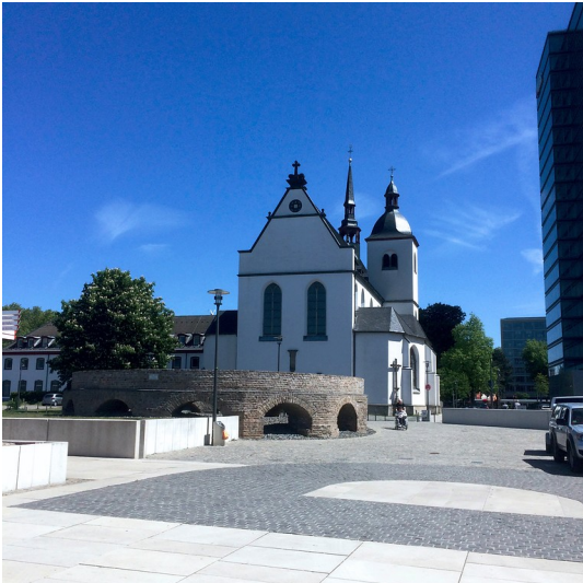
Die Abteikirche der früheren Benediktinerabtei St. Heribertus in Köln-Deutz (2019).