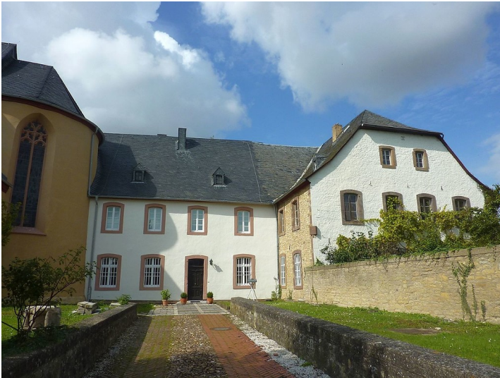
Klostergebäude der 1802 aufgehobenen Zisterzienserinnenabtei "St. Stephani Auffindung" in Zülpich-Bürvenich (2015), links davon die heutige Pfarrkirche St. Stephanus.