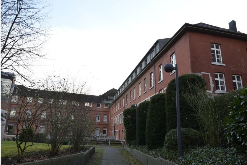
Ostflügel der Abtei in Aachen-Burtscheid (2015)