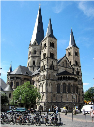
Cassiusstift (Münster in Bonn), Ansicht der Stiftskirche von Osten (2011)