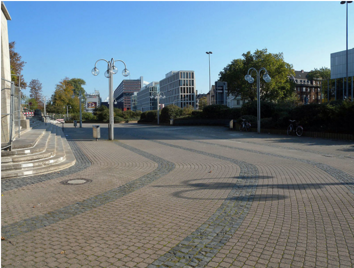
Der Ottoplatz in Köln-Deutz (2011)