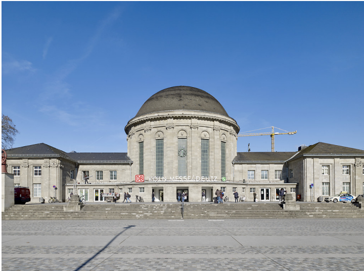
Bahnhof Köln Messe/Deutz