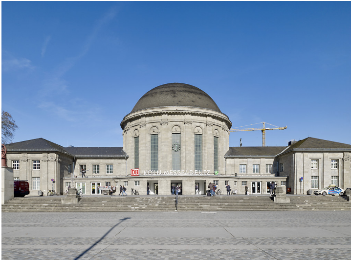
Bahnhof Köln Messe/Deutz