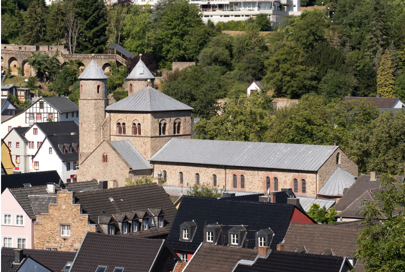
Bad Münstereifel: Stiftskirche Sankt Chrysanthus und Daria (2019).