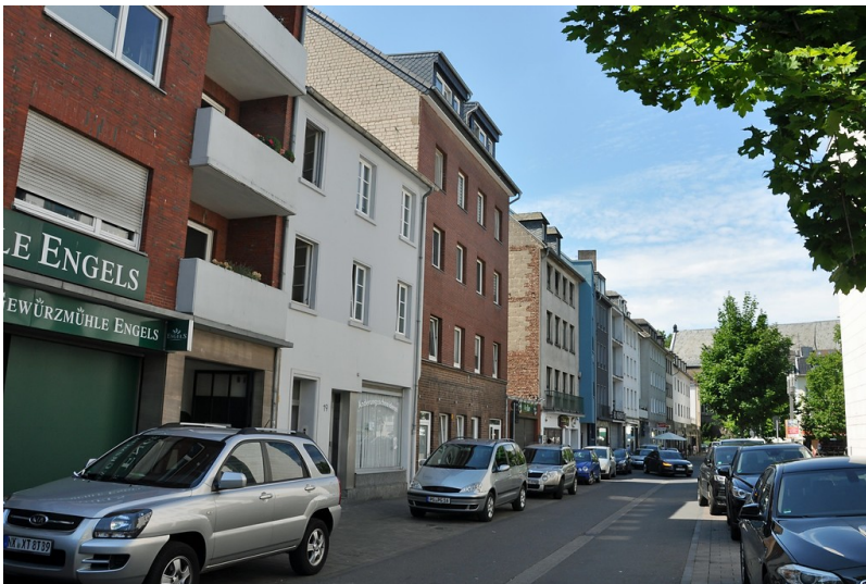
Blick in die Hymgasse in Neuss, früherer Standort des Zisterzienserpriorats Kamperhof (2017).