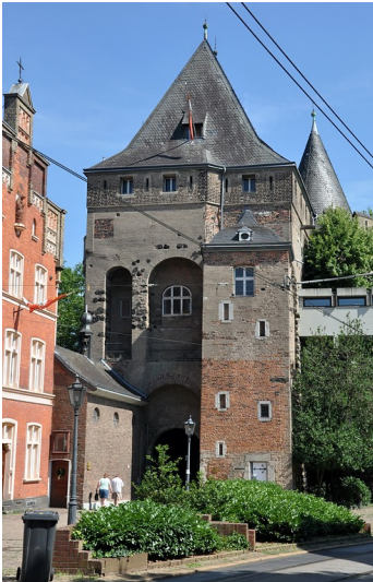
Blick auf das Obertor in Neuss von der Stadtseite aus (2017), zugleich früherer Standort des Augustiner-Chorherrenstifts Neuss.