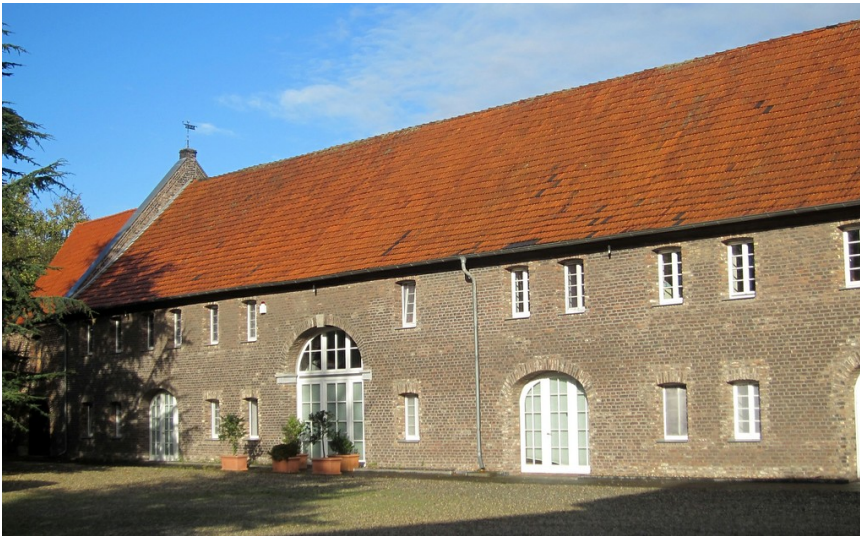
Blick in den Innenhof des früheren Klosters Meer (2014).