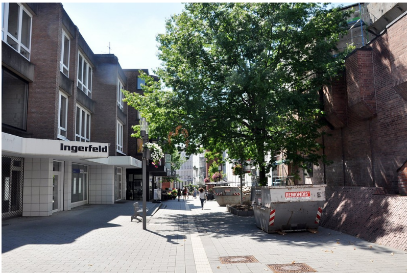
Die Straße "Am Konvent" in Neuss Richtung Südwesten, früherer Standort des Prämonstratenserinnenkonvents St. Laurentius (2017).