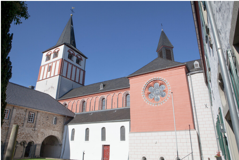
Kirche der Benediktinerpropstei Oberpleis (2015)