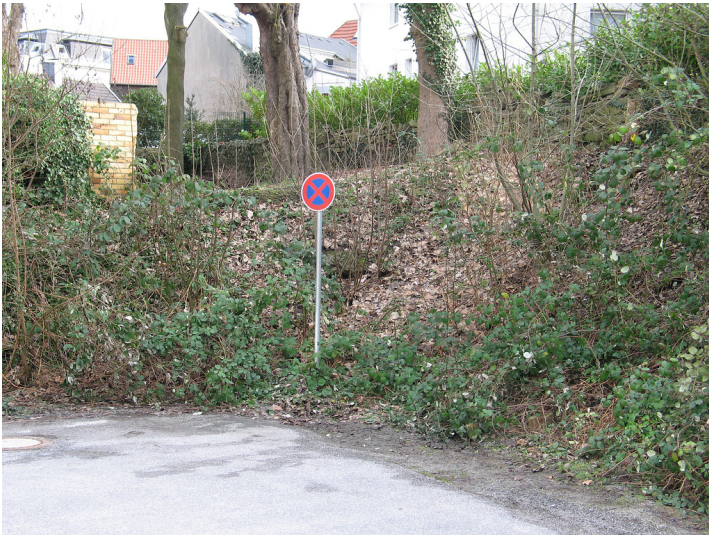
Abschnitt der Stiftsmauer in Essen-Rellinghausen (2011)