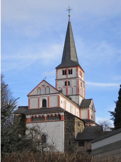
Die Doppelkirche in Schwarzhemdorf von Westen