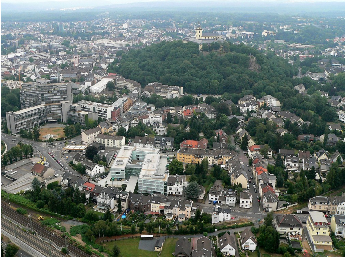
Die Stadt Siegburg mit der Abtei auf dem Michaelsberg, Kreishaus, Polizeiwache und städtischem Mühlengraben im Luftbild (2011)