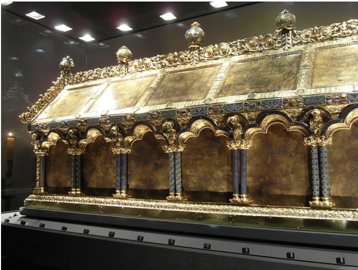
Der Schrein des Kölner Erzbischofs Anno II. (um 1010-1075) in der Siegburger Abteikirche Michaelsberg (2009). Seit 2021 werden die Reliquien des Heiligen in einen neugeschaffenen modernen Schrein in der neuen Annokapelle bewahrt.