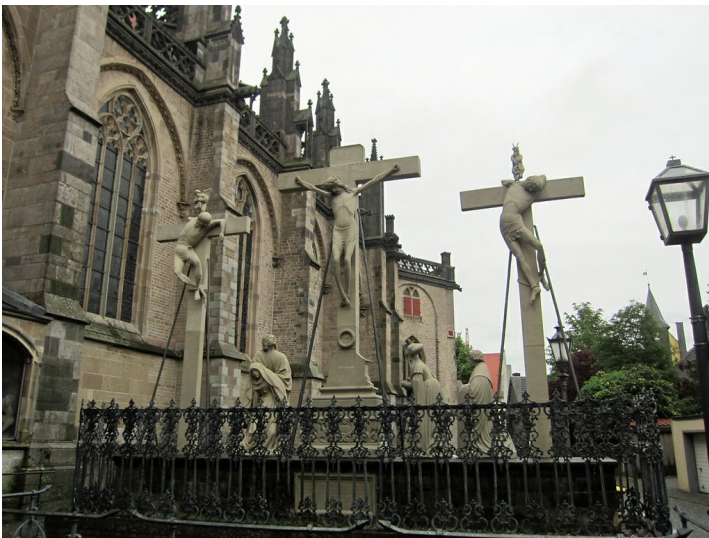
Kreuzigungsdarstellung südöstlich der Kirche des Kollegiatstifts St. Viktor in Xanten (2013)