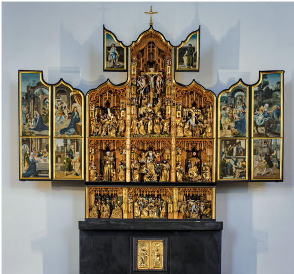
Zülpich, Kirche Sankt Peter