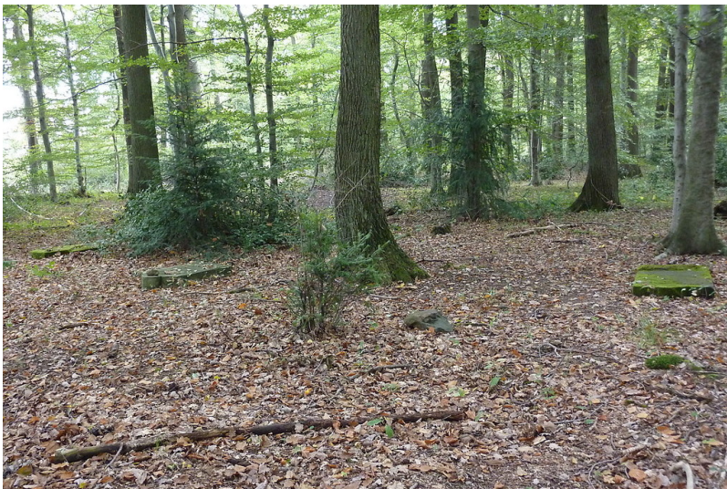
Blick auf das überwachsene Gräberfeld des jüdischen Friedhofs an der Tomburg in Rheinbach-Wormersdorf (2010).