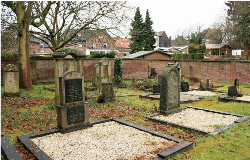
Grabsteine auf dem Gräberfeld im nördlichen Bereich des jüdischen Friedhofs Roßweide in Mönchengladbach-Wickrath (2015). In Blickrichtung der hinter der Friedhofsmauer gelegenen Straße "Am Kauert" befand sich möglicherweise der alte jüdische Friedhof "Flieth".