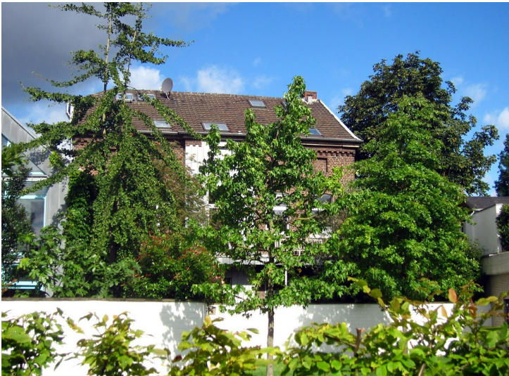
Rückseite des Grundstücks, auf dem sich der ehemalige jüdische Friedhof in Wevelinghoven befand (2014)