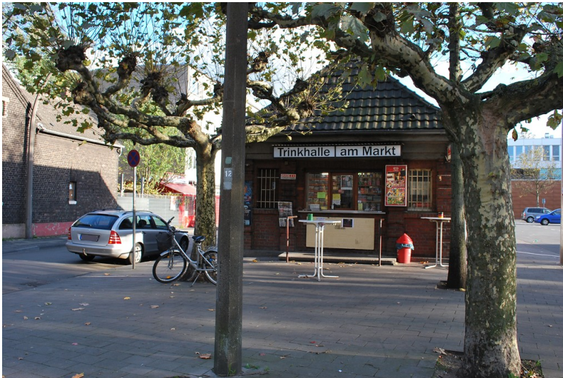
Ein Eingang zum Tiefbunker unter dem Marktplatz befindet sich in dem als Kiosk genutzten Backsteinhäuschen (2013).