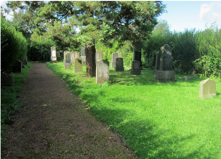
Grabsteine auf dem jüdischen Friedhof in Wevelinghoven (2014)