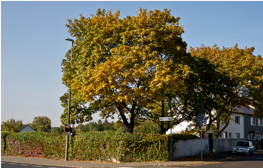
Blick von außen auf den jüdischen Friedhof in der Römerstraße in Wesseling (2011).