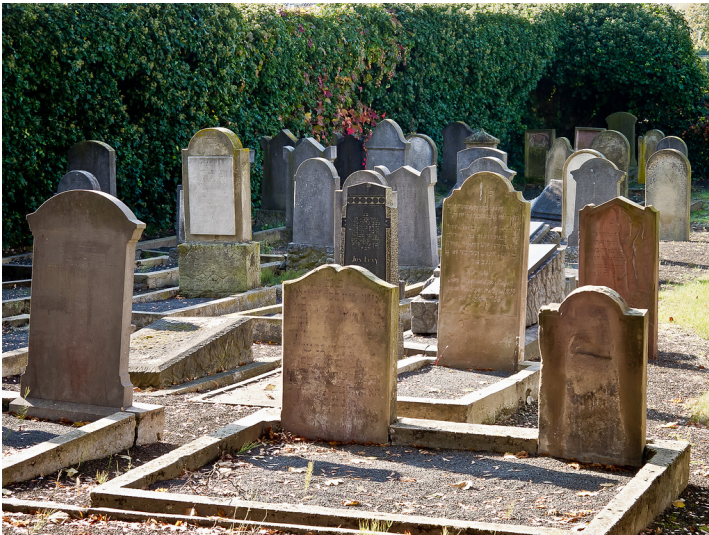
Gräberfeld auf dem jüdischen Friedhof in der Römerstraße in Wesseling (2011).