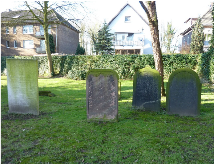
Grabsteine auf dem alten jüdischen Friedhof Esplanade in Wesel (2011)