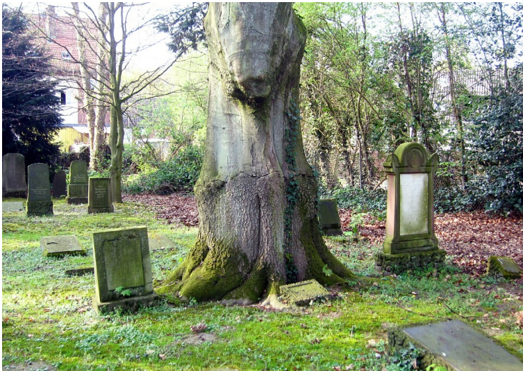
Grabstellen neben einem Altbaum auf dem Jüdischen Friedhof am Ostglacis in Wesel (2014)